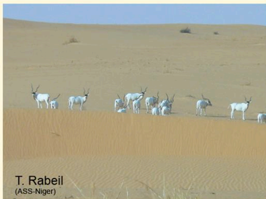
T. Rabeil (ASS-Niger)

Budget du projet de conservation : 950 000 000 F CFA pour la période de 2009 à 2011.