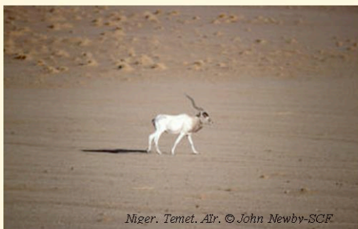
Niger. Temet. Air.

Budget annuel : 676 667 $US (financement GEF via projet COGERAT). Le budget de l'Etat étant très restreint comparé aux besoins en terme de gestion pour l'AP, celle-ci ne pourrait pas fonctionner sans l'apport de fonds externes.